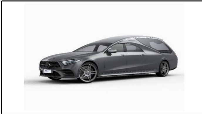
AYMON meccanica CLS Coupè Mercedes-Benz